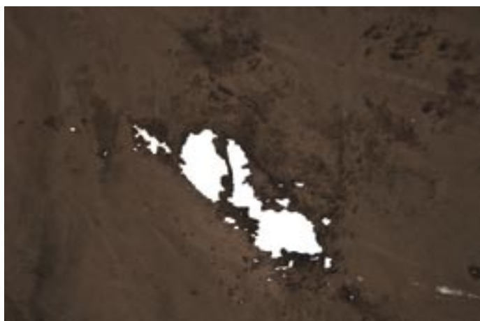
Elgskinn med slepeskader