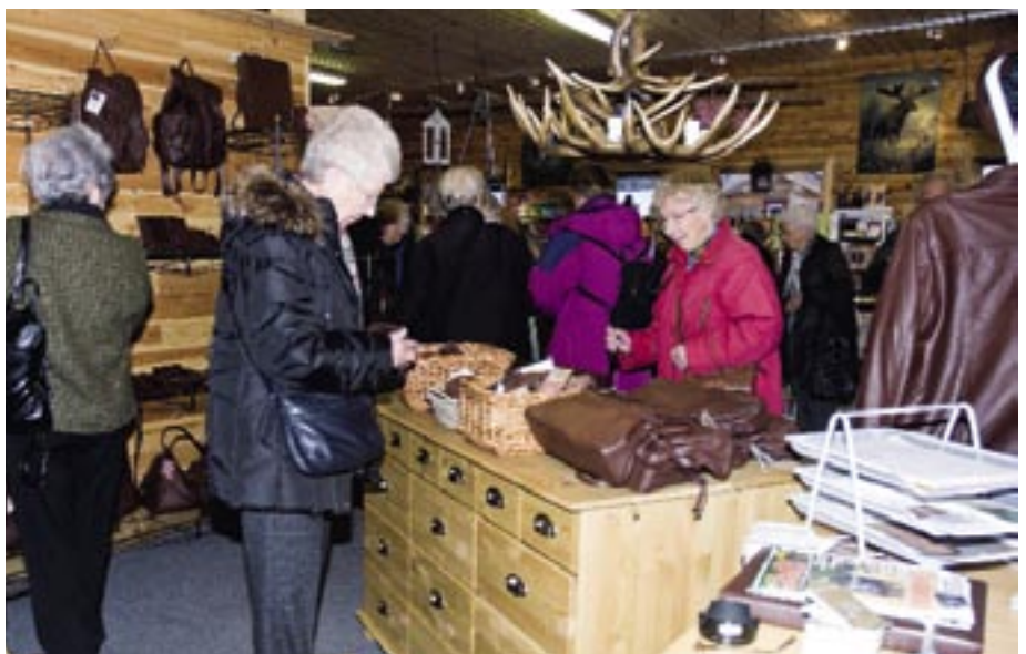
Fra butikken Svullrya i Grue Finnskog selger Finnskogs skinn elgskinnsvarer av alle typer.

– Prisen til jeger tror jeg ikke er viktigst for å få gode viltskinn. Jegerne får rundt en hundrelapp pr skinn. Jeg betalte det dobbelte for noen år siden.