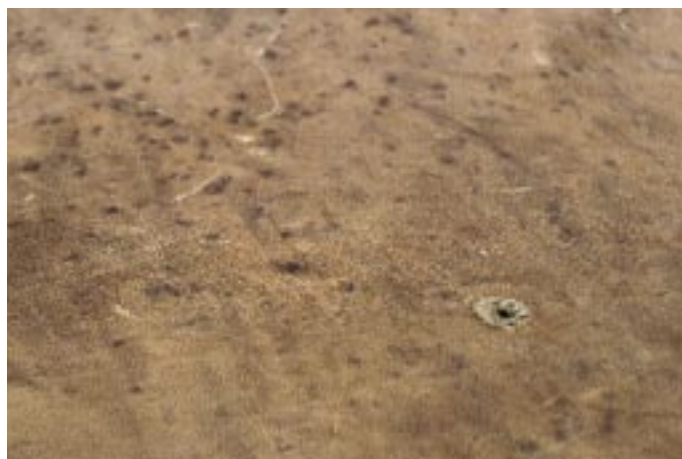
Elgskinn med skader etter hjortelusflue